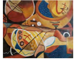
Sem Título I