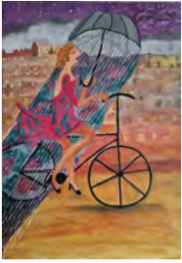
Rapariga da Bicicleta